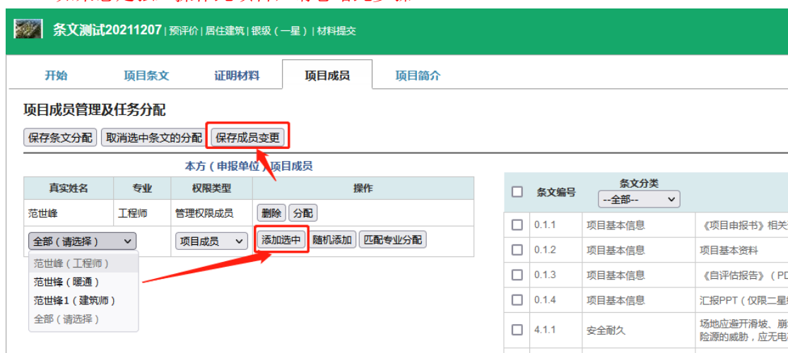
图 1-6 添加团队成员页面