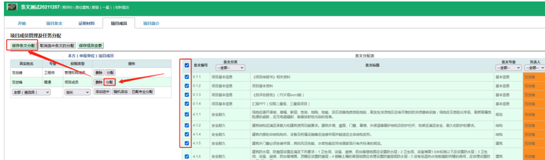
图 1-6 意见校核发送通知页面