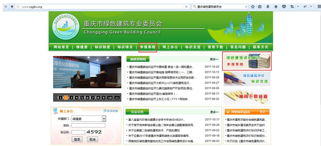
图 1-1 重庆绿建委网站在线申报入口

在线申报重庆市绿色建筑评价标识必须通过重庆市绿色建筑委员会官网 ( http://www.cqgbc.org )，点击“申报系统”菜单选项或 BANNER 按钮（图 1-1），进入用户登入界面（图 1-2），根据界面登录步骤进行用户注册与登录。